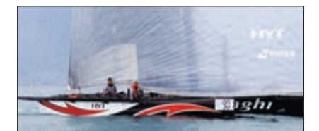
Alinghi, 2 e en 2016 et vainqueur l'an dernier

Introduit en 2016, Aper Ô lac permet d'assister au Bol d'Or depuis les quais. A cette occasion, le Caveau ouvre exceptionnellement samedi dès 11