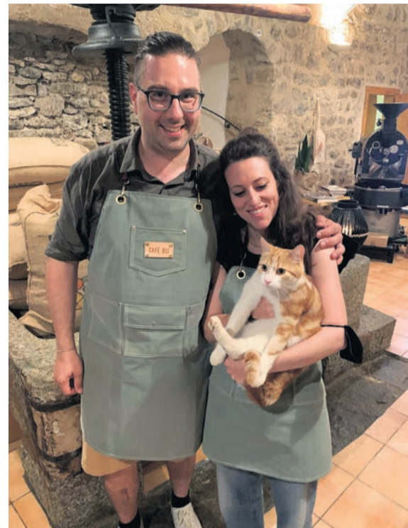
CS pour LABEL

Café Oli Chemin de Villette 16 1096 Villette (Lavaux) www.cafeoli.ch